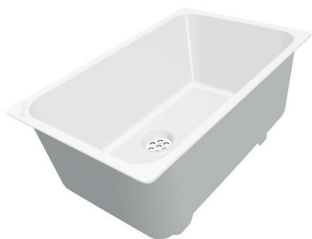
Cuvette blanche 8153 100