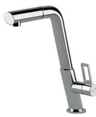
Mitigeur KE 8492 000