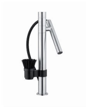
Mitigeur Bert 8428 100