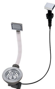
Vidange automatique 8407 113