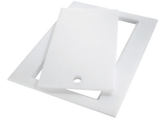
Planche de découpe Twin in HDPE 8644 101